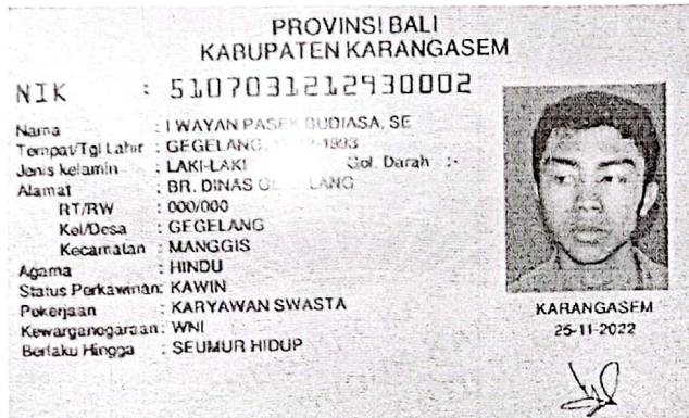
Sekretaris DPK Peradah Indonesia Karangasem